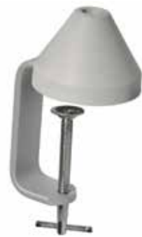
Morsetto di fissaggio