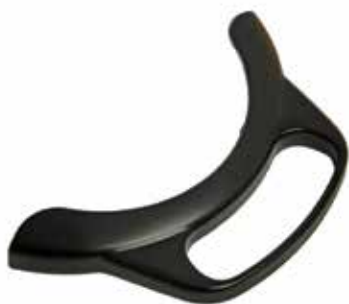
Maniglie per modello KFM LED