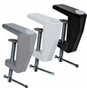
Morsetto di fissaggio laterale