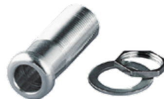
TE Table Bushing