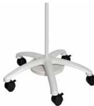
Stativo a pavimento (Trolley) con peso supplementare