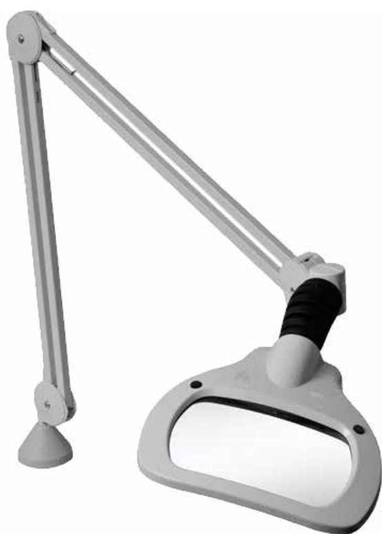
Ingrandimento Wave LED / LED ESD / LED UV

Timer e regolazione: Step di regolazione 0-50-100%. Illuminazione parzializzabile a sinistra / destra. Funzione di autospegnimento.